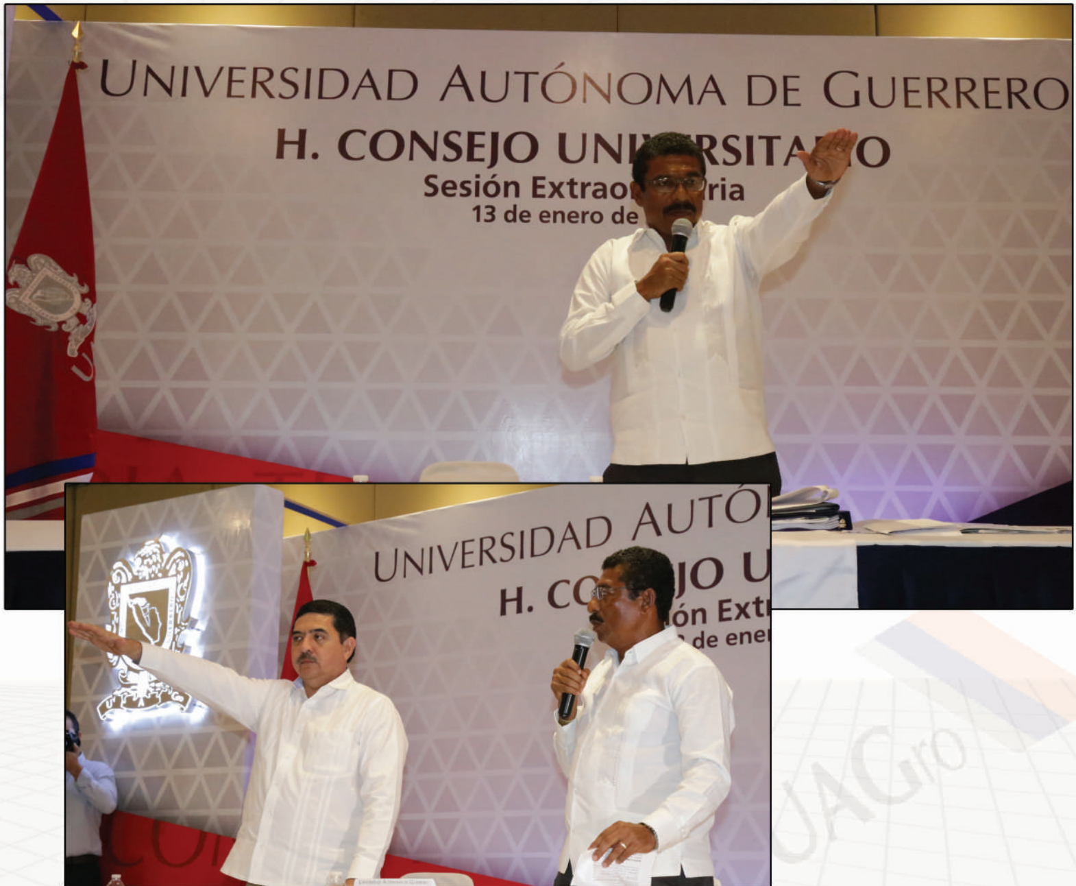
Primera y segunda sesiones extraordinarias 13 de enero del 2017